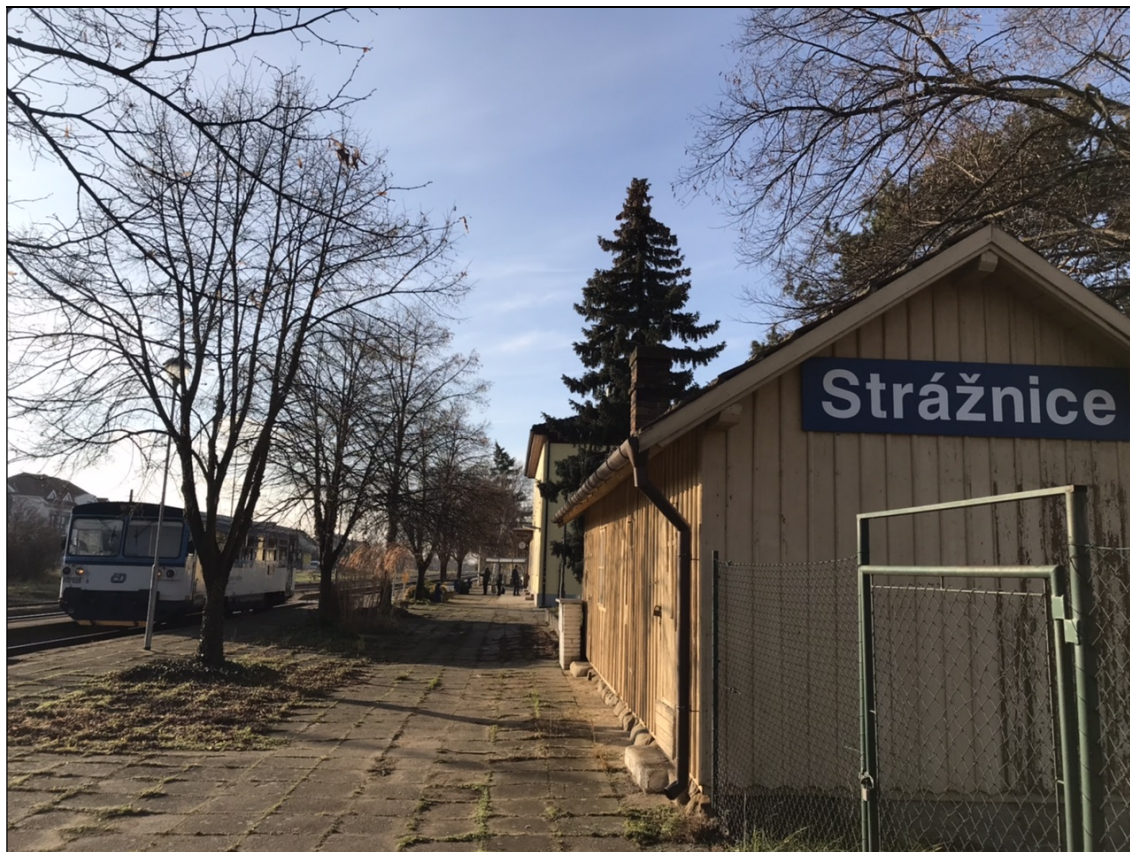
Obrázek č. 4: Pohled na trativod (stromy s poř. č. 102, 103 8, 7)