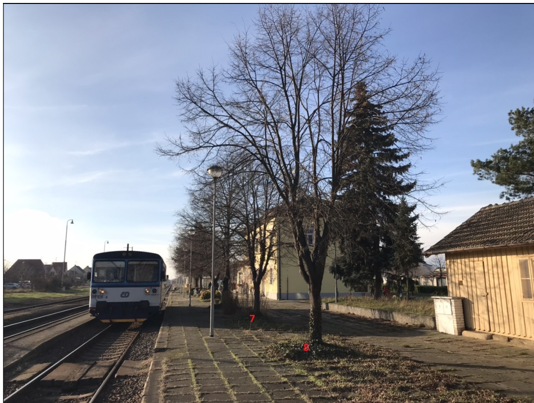
Obrázek č. 2: Pohled na lípu s poř. č. 8 a 7