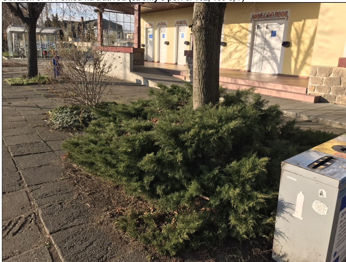
Obrázek č. 5: Pohled na porost s poř. č. 201 a 202 s lípou uprostřed (poř. č. 6)