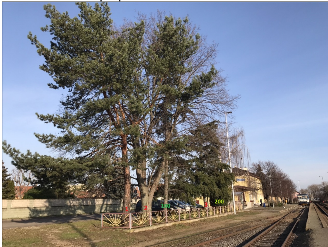
Obrázek č. 3: Pohled na skupinu dřevin na pozemku č. 3122/30