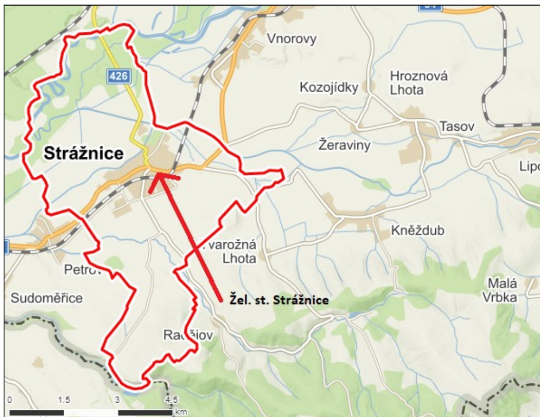
Obrázek č. 1: Lokalizace záměru

Uvedený dokument je podkladem pro rozhodnutí k povolení ke kácení – zahrnuje dendrologický průzkum, popisuje rozsah i metodiku kácení.